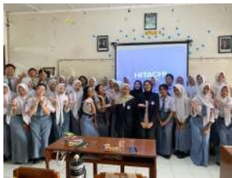
Gambar 1. Dokumentasi Akhir Kegiatan