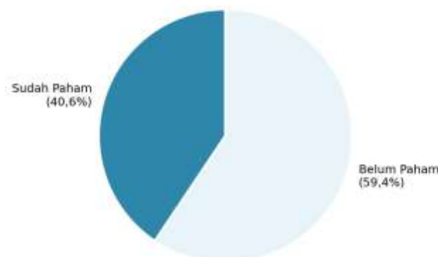
Gambar 3. Hasil test kemampuan dasar siswa SMK N 1 Surakarta pengabdian filsafat hukum bisnis yang diuji pada awal kegiatan.