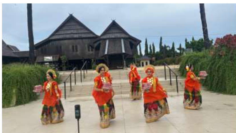
Gambar 3. Proses Pengambilan Gambar Video Pembelajaran Tari Bosara

Proses produksi media pembelajaran dilakukan melalui perekaman gerak tari menggunakan perangkat dokumentasi digital. Pengambilan gambar dilakukan secara sistematis dengan memperhatikan ketepatan gerak, kualitas visual, serta kesesuaian materi dengan tujuan pembelajaran. Hasil perekaman kemudian melalui proses validasi untuk memastikan bahwa materi yang disajikan tetap sesuai dengan pakem Tari Bosara dan tidak mengalami distorsi nilai budaya.