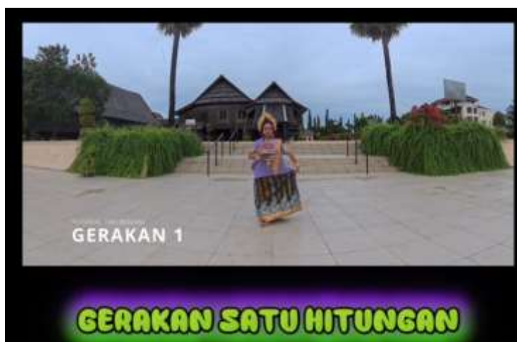
Gambar 5. Proses Validasi dan Penyempurnaan E-Media Ajar Tari Bosara (Masukkan dokumentasi validasi konten dan penyempurnaan media dari laporan kegiatan)

Kegiatan pendampingan juga mencakup proses validasi konten tari untuk memastikan bahwa seluruh materi yang disajikan tetap sesuai dengan pakem Tari Bosara. Berdasarkan hasil validasi, gerakan, penggunaan properti Bosara, pola lantai, dan nilai budaya yang ditampilkan dinilai telah sesuai dengan karakteristik Tari Bosara sebagai salah satu warisan budaya masyarakat Bugis-Makassar. Temuan ini menunjukkan bahwa proses digitalisasi budaya dapat dilakukan tanpa menghilangkan nilai autentik yang terkandung dalam seni tradisional. Hasil tersebut sejalan dengan pendapat Branch (2019) yang menyatakan bahwa proses revisi dan validasi merupakan bagian penting dalam pengembangan media pembelajaran untuk menjamin kualitas dan kesesuaian materi dengan tujuan pembelajaran.