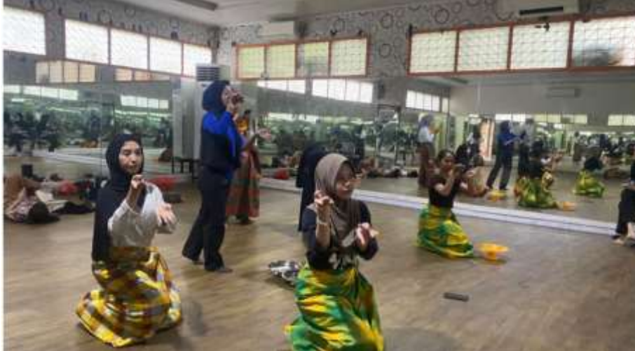
Gambar 2. Pelatihan Tari Bosara Bersama Pelatih Sanggar

Gambar 1 memperlihatkan proses pelatihan Tari Bosara yang dilakukan bersama pelatih sanggar dan tim pengabdian. Kegiatan ini menunjukkan keterlibatan aktif anggota sanggar dalam mempelajari teknik gerak sekaligus mempersiapkan materi yang akan dikembangkan menjadi media pembelajaran digital.