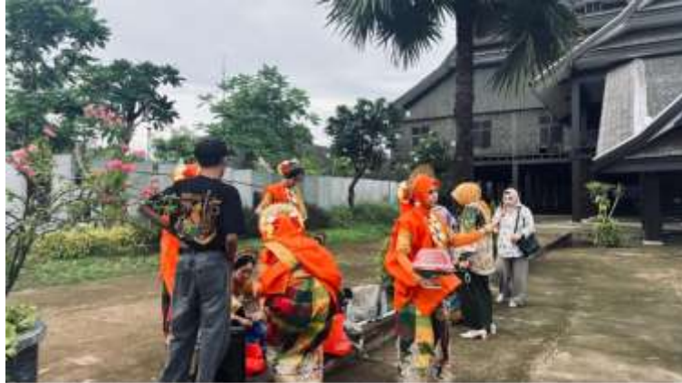
Gambar 4. Proses Validasi Konten Tari Bosara

Kegiatan validasi konten juga menjadi bagian penting dalam workshop untuk memastikan kualitas produk yang dihasilkan. Validasi dilakukan oleh ahli tari tradisional yang meninjau kesesuaian gerak, pola lantai, penggunaan properti, serta makna budaya yang terkandung dalam materi pembelajaran. Tahapan ini penting untuk menjaga autentisitas budaya dalam proses digitalisasi tari tradisional.