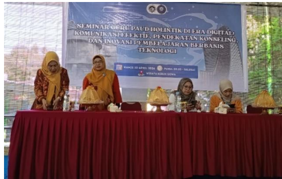
Gambar 4. Presentasi hasil penyusunan RPPH oleh peserta workshop

Hasil workshop menunjukkan adanya peningkatan pemahaman peserta mengenai pentingnya pembelajaran yang berpusat pada anak. Guru mulai memahami bahwa pembelajaran tidak hanya berfokus pada penyampaian materi, tetapi juga pada pemberian pengalaman belajar yang memungkinkan anak aktif mencari tahu, mencoba, dan menemukan pengetahuan melalui aktivitas yang bermakna. Temuan ini sejalan dengan prinsip pendidikan anak usia dini yang menempatkan anak sebagai subjek utama dalam proses pembelajaran sehingga guru berperan sebagai fasilitator yang menyediakan lingkungan belajar yang mendukung perkembangan anak secara optimal.