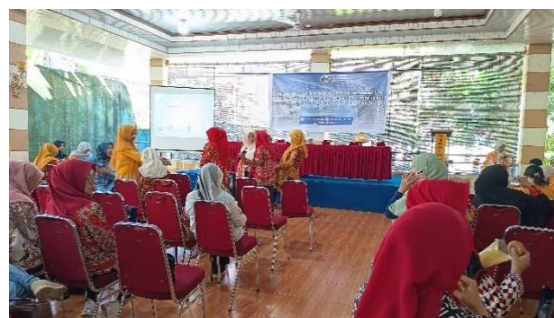
Gambar 3. Peserta melakukan diskusi dan praktik penyusunan RPPH

Setelah sesi penyampaian materi, peserta dibagi ke dalam tujuh kelompok untuk mengikuti kegiatan praktik penyusunan Rencana Pelaksanaan Pembelajaran Harian (RPPH). Pada tahap awal, sebagian peserta masih mengalami kesulitan dalam merumuskan kegiatan pembelajaran yang benar-benar berpusat pada anak. Guru cenderung menyusun kegiatan yang berorientasi pada instruksi guru dan hasil akhir pembelajaran. Namun, melalui proses pendampingan, diskusi kelompok, serta umpan balik dari narasumber, peserta mulai memahami cara merancang aktivitas yang memberikan ruang lebih besar bagi anak untuk bereksplorasi, memilih kegiatan, berinteraksi, dan belajar melalui pengalaman langsung.