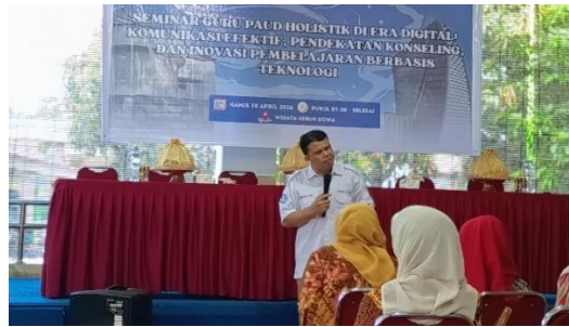
Gambar 2. Penyampaian materi workshop kepada peserta

Selama pelaksanaan workshop, peserta menunjukkan antusiasme yang tinggi. Hal ini terlihat dari keterlibatan aktif peserta dalam diskusi, tanya jawab, dan berbagi pengalaman terkait praktik pembelajaran yang selama ini diterapkan di sekolah masing-masing. Berbagai pertanyaan diajukan oleh peserta, terutama mengenai cara mengembangkan kegiatan pembelajaran yang lebih variatif dan mengurangi ketergantungan pada metode ceramah maupun penggunaan lembar kerja yang selama ini masih banyak digunakan dalam kegiatan pembelajaran.