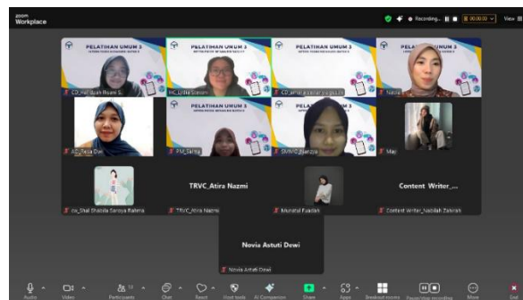
Gambar 3. Pelaksanaan Pelatihan Komunikasi

Pelaksanaan kegiatan dilakukan melalui metode ceramah, diskusi interaktif, simulasi, roleplay , dan tanya jawab. Metode tersebut dipilih agar peserta tidak hanya memperoleh pemahaman teoritis mengenai komunikasi profesional, tetapi juga mampu mempraktikkan keterampilan komunikasi secara langsung dalam situasi yang menyerupai dunia kerja nyata. Pelatihan berlangsung secara interaktif dengan melibatkan peserta dalam berbagai aktivitas komunikasi interpersonal.