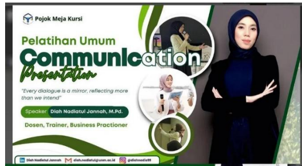
Gambar 2. Materi Pelatihan Komunikasi

ketika berbicara dengan atasan atau mentor kerja, serta belum memahami etika komunikasi di lingkungan profesional.