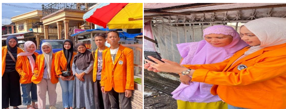
Gambar 2. Pengenalan UMKM