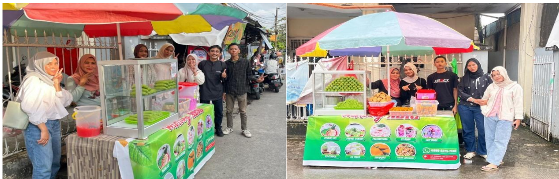
Gambar 4. Evaluasi Hasil Inovasi

Mahasiswa dengan arahan Dosen Kewirausahaan melakukan penguatan branding melalui pembuatan spanduk. Intervensi ini terbukti meningkatkan visibilitas usaha dan menarik perhatian konsumen di lokasi penjualan (Bharadwaj et al., 2020; Verhoef et al., 2021).