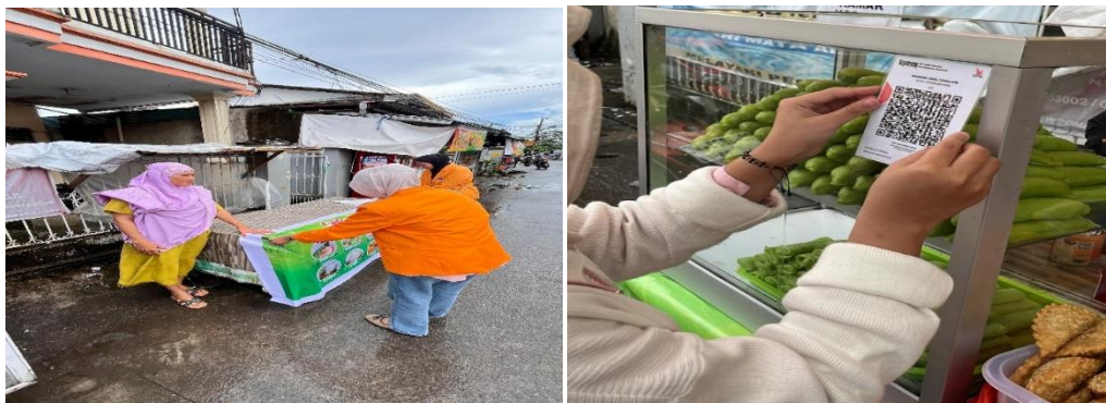
Gambar 3. Tahap Implementasi Awal

Mahasiswa bersama pelaku UMKM melakukan co-creation inovasi produk dengan menambahkan menu es buah. Diversifikasi ini meningkatkan variasi produk dan memberikan nilai tambah bagi konsumen (Ratten, 2020; Li et al., 2020). Mahasiswa juga terlibat langsung dalam proses penjualan, sehingga memungkinkan terjadinya transfer pengetahuan secara praktis terkait pelayanan dan interaksi dengan konsumen. Keterlibatan ini memperkuat pemahaman mahasiswa sekaligus meningkatkan kapasitas pelaku usaha (Kolb, 2021; Eylar, 2020).