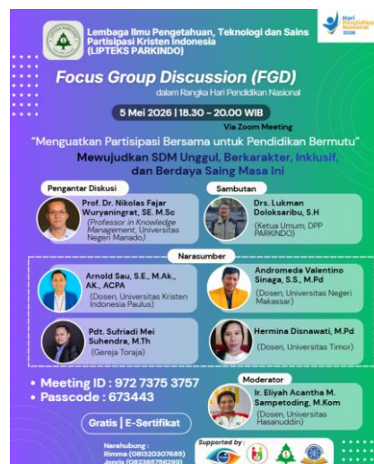
Gambar 2. Poster Kegiatan FGD

Tahap persiapan dilakukan dengan menetapkan tema kegiatan, menyusun konsep acara, menentukan narasumber, menyiapkan media publikasi, serta melakukan koordinasi teknis pelaksanaan FGD. Tema yang diangkat adalah “Menguatkan Partisipasi Bersama untuk Pendidikan Bermutu” dengan subfokus pembahasan mengenai perwujudan sumber daya manusia yang unggul, berkarakter, inklusif, dan berdaya saing. Pada tahap ini, panitia juga menyiapkan perangkat pendukung kegiatan daring, seperti tautan Zoom Meeting, susunan acara, moderator, dokumentasi, serta daftar peserta.