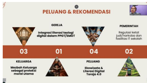
Gambar 4. Pemaparan Materi oleh Narasumber Terkait “Peluang & Rekomendasi”

teologis, pendidikan dipandang sebagai mandat untuk memulihkan martabat manusia, sehingga proses belajar perlu dimaknai sebagai bagian dari pembentukan akal budi, karakter, dan iman.