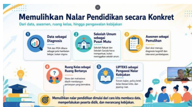
Gambar 6. Rekomendasi Terkait Nalar Pendidikan

Pemateri menekankan pentingnya pemulihan nalar pendidikan. Pendidikan bermutu tidak semestinya hanya diukur melalui skor, ranking, akreditasi, proyek, atau daya saing, tetapi harus menyentuh aspek nalar, karakter, inklusivitas, kemerdekaan berpikir, tanggung jawab, dan integritas. Data pendidikan seperti TKA dan PISA perlu dibaca sebagai alat diagnosis untuk memahami hambatan belajar, bukan sebagai vonis terhadap peserta didik maupun sekolah.