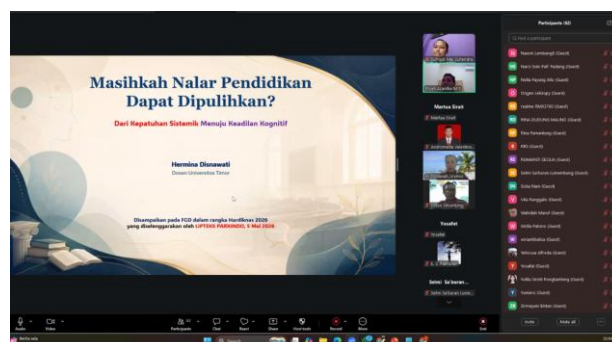
Gambar 3. Pemaparan Materi oleh Narasumber Terkait “Nalar Pendidikan”

Kegiatan ini diikuti oleh sekitar 70 peserta yang berasal dari berbagai latar belakang. Kehadiran peserta hingga akhir kegiatan menunjukkan adanya antusiasme dan perhatian yang tinggi terhadap isu pendidikan bermutu. Partisipasi aktif peserta dalam mengikuti pemaparan dan diskusi memperlihatkan bahwa tema yang diangkat relevan dengan kebutuhan dan tantangan pendidikan saat ini.