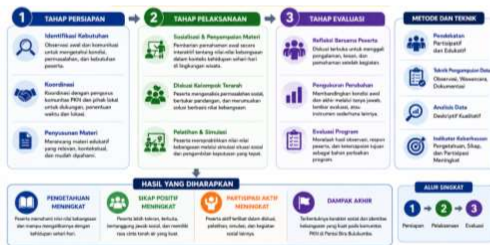
Gambar 1. Framework atau Alur Pelaksanaan Kegiatan

Metode ini dirancang untuk memastikan keterlibatan aktif peserta dan keberlanjutan dampak program. Analisis data dilakukan secara deskriptif kualitatif dengan menelaah hasil observasi, wawancara, serta respon peserta selama kegiatan berlangsung (Wekke, 2022). Indikator keberhasilan kegiatan dilihat dari peningkatan pemahaman peserta terhadap nilai-nilai kebangsaan, perubahan sikap sosial, serta partisipasi aktif dalam setiap rangkaian kegiatan. Dengan metode ini, diharapkan program pengabdian masyarakat dapat memberikan dampak yang signifikan dalam memperkuat karakter sosial dan identitas kebangsaan pada komunitas PKN di Pantai Bira Bulukumba.