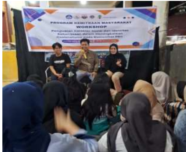
Gambar 3. Sesi Diskusi

Melalui diskusi kelompok, peserta tidak hanya menjadi penerima informasi, tetapi juga aktif dalam menganalisis kondisi sosial yang terjadi di lingkungan mereka. Peserta mulai menyadari bahwa perubahan sosial yang terjadi akibat globalisasi harus disikapi secara bijaksana agar tidak menghilangkan nilai-nilai budaya lokal dan identitas kebangsaan. Selain itu, diskusi kelompok juga melatih kemampuan berpikir kritis peserta dalam memahami berbagai fenomena sosial dan mencari solusi yang sesuai dengan nilai-nilai kebangsaan. Hal ini sejalan dengan pendapat (Widiyanto et al. 2024) yang menyatakan bahwa pembelajaran partisipatif mampu meningkatkan kemampuan berpikir kritis serta memperkuat internalisasi nilai kebangsaan melalui pengalaman belajar yang aktif dan kolaboratif.