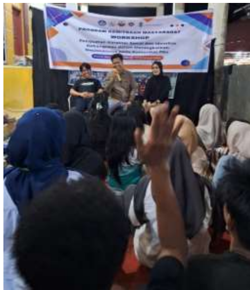
Gambar 4. Pelaksanaan dan simulasi

Melalui diskusi kelompok, peserta tidak hanya menjadi penerima informasi, tetapi juga aktif dalam menganalisis kondisi sosial yang terjadi di lingkungan mereka. Peserta mulai menyadari bahwa perubahan sosial yang terjadi akibat globalisasi harus disikapi secara bijaksana agar tidak menghilangkan nilai-nilai budaya lokal dan identitas kebangsaan. Selain itu, diskusi kelompok juga melatih kemampuan berpikir kritis peserta dalam memahami berbagai fenomena sosial dan mencari solusi yang sesuai dengan nilai-nilai kebangsaan. Hal ini sejalan dengan pendapat (Widiyanto et al. 2024) yang menyatakan bahwa pembelajaran partisipatif mampu meningkatkan kemampuan berpikir kritis serta memperkuat internalisasi nilai kebangsaan melalui pengalaman belajar yang aktif dan kolaboratif.