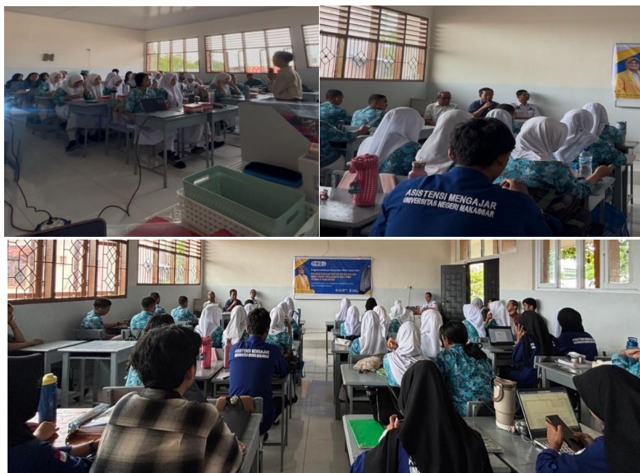
Gambar 1. Pelaksanaan penyuluhan edukasi bullying di SMA Negeri 8 Kota Makassar

Berdasarkan data kegiatan, jumlah peserta yang mengikuti kegiatan sebanyak 36 siswa. Kegiatan berlangsung di lingkungan sekolah dengan dukungan fasilitas yang memadai untuk pelaksanaan penyuluhan, diskusi kelompok, dan simulasi kasus. Bentuk kegiatan yang dilaksanakan meliputi penyuluhan edukatif, diskusi interaktif, simulasi kasus (role-play), serta penguatan keterampilan sosial-emosional siswa terkait pencegahan bullying. Materi yang diberikan mencakup pengenalan bullying dalam perspektif sosiologi dan pendidikan, dampak bullying terhadap kesehatan mental dan karakter siswa, peran siswa sebagai agent of change, serta keterampilan komunikasi asertif dan resolusi konflik sederhana. Seluruh rangkaian kegiatan dilaksanakan sesuai tahapan yang telah dirancang dalam proposal kegiatan, dimulai dari koordinasi dengan pihak sekolah, pelaksanaan pretest, penyampaian materi, simulasi kasus, posttest, hingga evaluasi kegiatan bersama peserta. Berdasarkan dokumentasi kegiatan peserta terlihat mengikuti kegiatan secara aktif selama proses penyuluhan dan diskusi berlangsung.