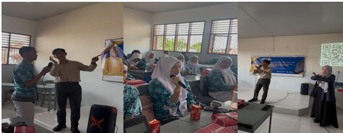
Gambar 3. Diskusi dan simulasi role-play peserta kegiatan

Pada sesi penyampaian materi mengenai bullying dalam perspektif sosiologi dan pendidikan, peserta terlihat memperhatikan materi yang disampaikan oleh pemateri dan mengikuti diskusi yang dilakukan bersama tim pelaksana. Dalam sesi diskusi interaktif, siswa memberikan tanggapan terkait bentuk-bentuk bullying yang sering terjadi dalam lingkungan sekolah maupun pergaulan remaja. Beberapa siswa menyampaikan bahwa bullying verbal sering dianggap sebagai candaan dalam hubungan pertemanan sehari-hari. Pada sesi simulasi kasus atau role-play, siswa terlibat dalam praktik komunikasi asertif dan simulasi penanganan bullying baik sebagai korban, saksi, maupun pihak yang membantu korban. Berdasarkan lembar observasi kegiatan, peserta terlihat aktif dalam mengikuti simulasi dan diskusi kelompok yang dilaksanakan selama kegiatan berlangsung. Selain itu, observasi kegiatan juga menunjukkan adanya antusiasme siswa dalam membahas isu kesehatan mental dan hubungan sosial di lingkungan sekolah.